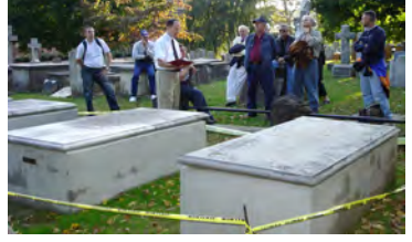
பிரின்ஸ்டன் மயானத்தில் ஜொனத்தன் எட்வர்ட்ஸ், ஹொட்ஜ், வோர்டீல்ட் போன்றோரின் கல்லறைகள்.

போதகர்களை உருவாக்கிய பயிற்சித் தளமாக இருந்தது. ஸ்கொட்லாந்து, அயர்லாந்து ஆகிய நாடுகளைச் சேர்ந்த போதகர்கள் இங்கு இறையியல் பயிற்சி பெற்று சிறந்த ஊழியக்காரர்களாக பணி புரிந்தனர். அத்தோடு கல்லூரியோடு தொடர்புடைய பல கல்வி ஸ்தாபனங்களும் உருவாக லொக் கொலேஜ் காரணமாக இருந்தது. இத்தகைய லொக் கொலேஜுகள் பல இடங்களில் அக்காலத்தில் உருவாகி போதகர்களுக்கு சிறந்த பயிற்சியளித்து வந்தன. திருச்சபையோடு பிரிக்கமுடியாத தொடர்புடையதாக அமைந்து, போதகர்களினால் மட்டும் பயிற்சியளிக்கப்பட்ட அன்றைய லொக் கொலேஜுகள் இன்று போதக பயிற்சி பற்றி நம்மைச் சிந்திக்க வைக்க வேண்டும்.