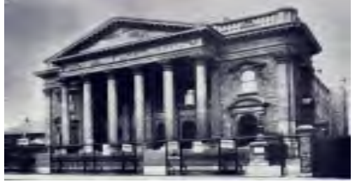
ஸ்பர்ஜன் தன் இறுதிக் காலம்வரை போதகராக இருந்த இலண்டன் மெட்ரொபொலிட்டன் டெபர்னேக்கள்

பொலிட்டன் டெபர்னேக் கள் (Metropolitan Tabernacle). ஒவ்வொரு ஞாயிறு தினமும் அதில் ஆறாயிரம் பேர் கூடிவந்து ஆராதித்தனர். உண்மையில், அத்தனைபேர் இருந்து ஆராதிக்க இக்கட்டிடம் கட்டப்படவில்லை. இக்கட்டிடம் பூரணமாகக் கட்டி முடிக்கப்படாத நிலையில் முதலாவது கூட்டம் 1860ம் ஆண்டு ஆகஸ்டு 21ம் நாள்