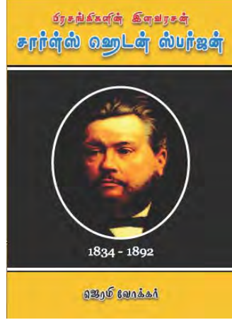
சார்ள்ஸ் ஹெடன் ஸ்பர்ஜன்