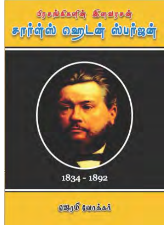
சார்ள்ஸ் ஹெடன் ஸ்பர்ஜன்